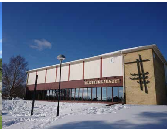
"Iggesunds badhus"