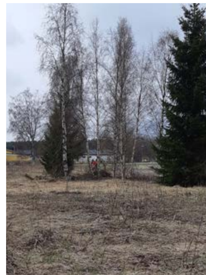
Barngruppen besökte området i april 2021

Vi besöker ofta parkområdet redan idag. Vi skulle gärna ha stora naturytor på förskolegården.